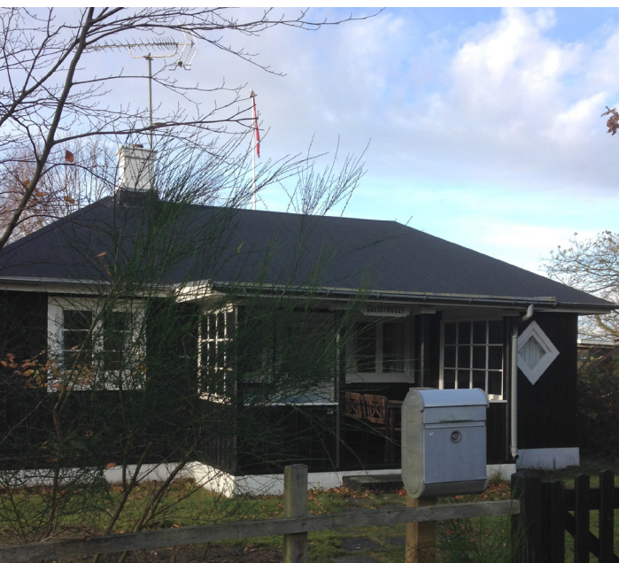
Sommerhuset i Hou, ca. 100 m. til dejlig strand.