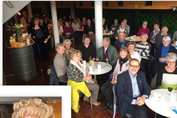
Publikum i Slagelse

Desværre må vi også her skære i aktiviteterne i de kommende sæsoner, fordi vi ikke får så stort et tilskud fra Gramex, men vi gør, hvad vi kan, for at holde både publikum og Solisterierne i live.