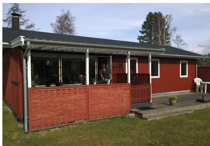
Sommerhuset i Klint ved Sj. Odde.