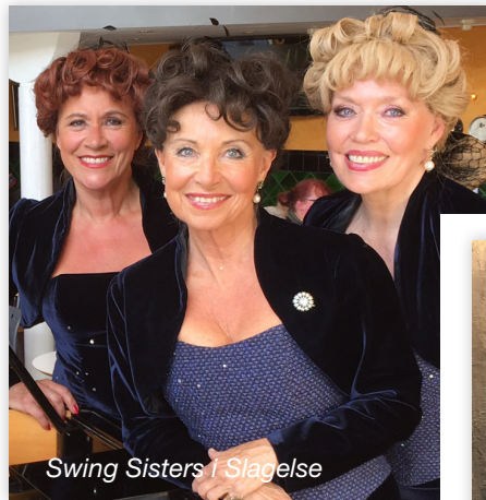
Swing Sisters i Slagelse